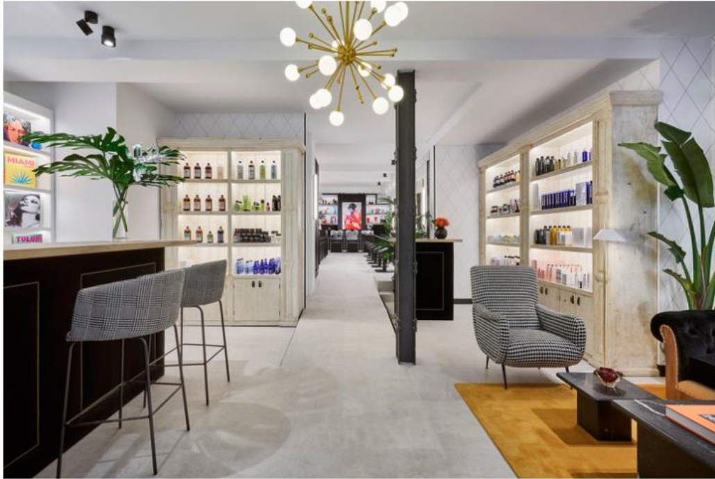
The Beauty Concept Hair, en Ortega y Gasset, 47 (Madrid).