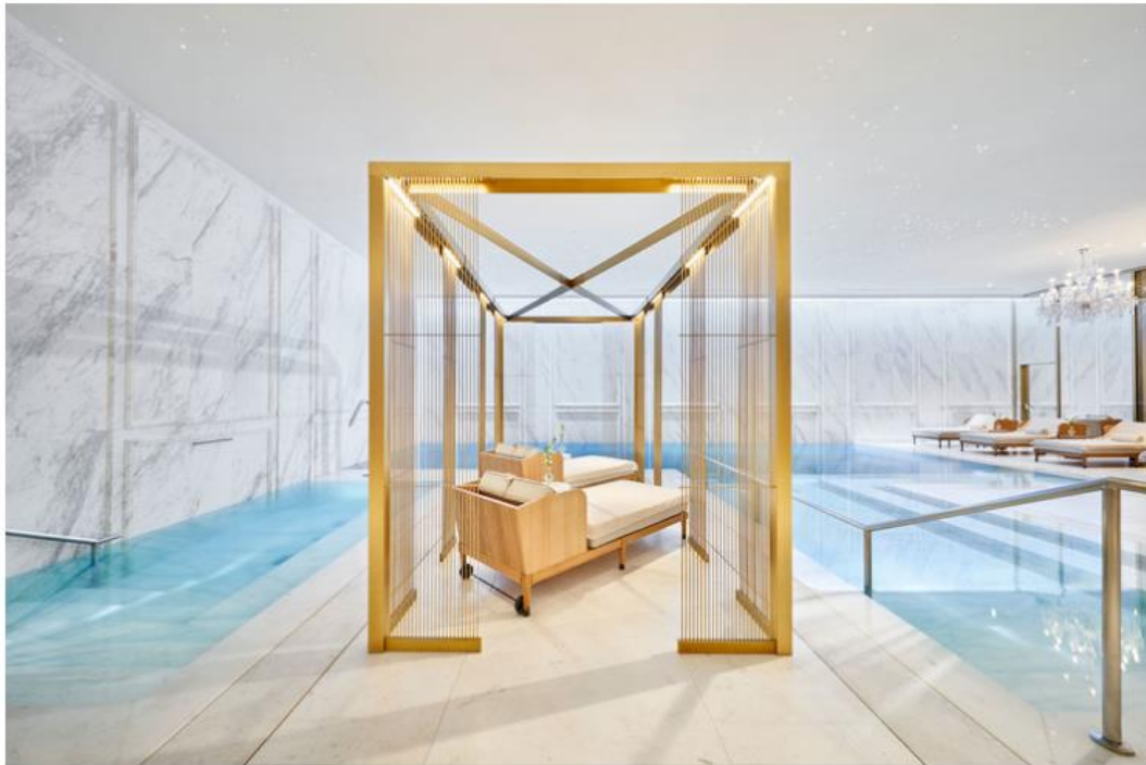
La zona wellness del Mandarin Oriental Ritz incluye una cabina de tratamiento de lujo.