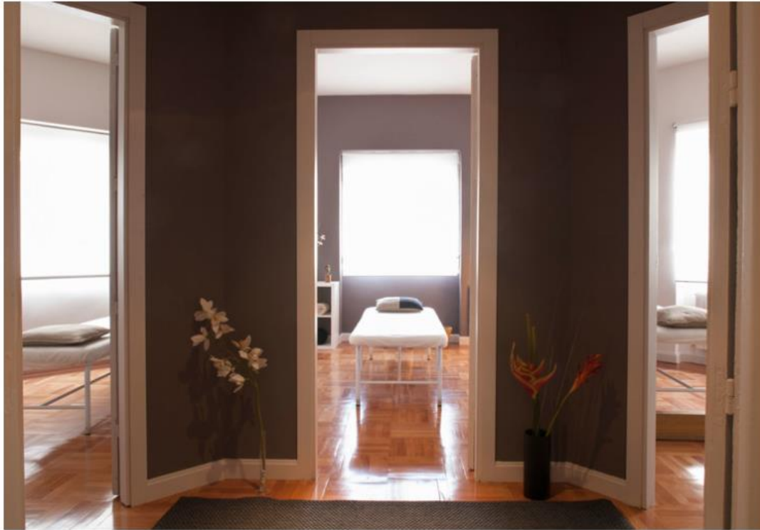
Cabinas del centro de salud y estética Assari.