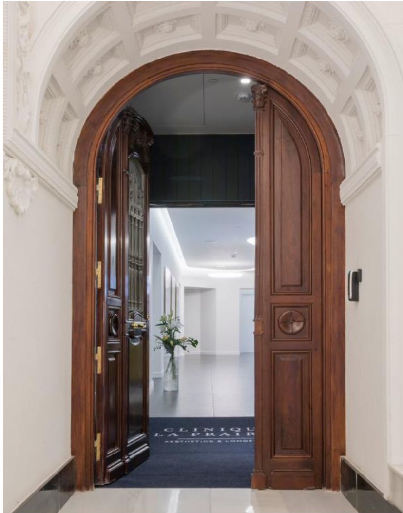
Entrada a la Clinique La Prairie de Madrid.